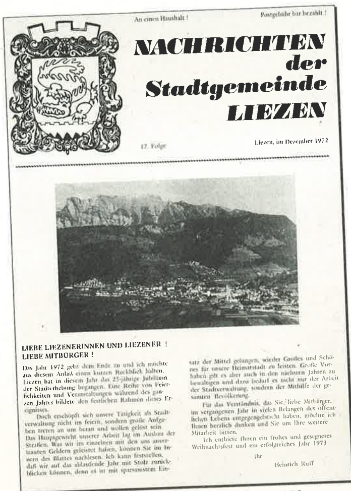
Die erste gedruckte Ausgabe im Dezember 1972