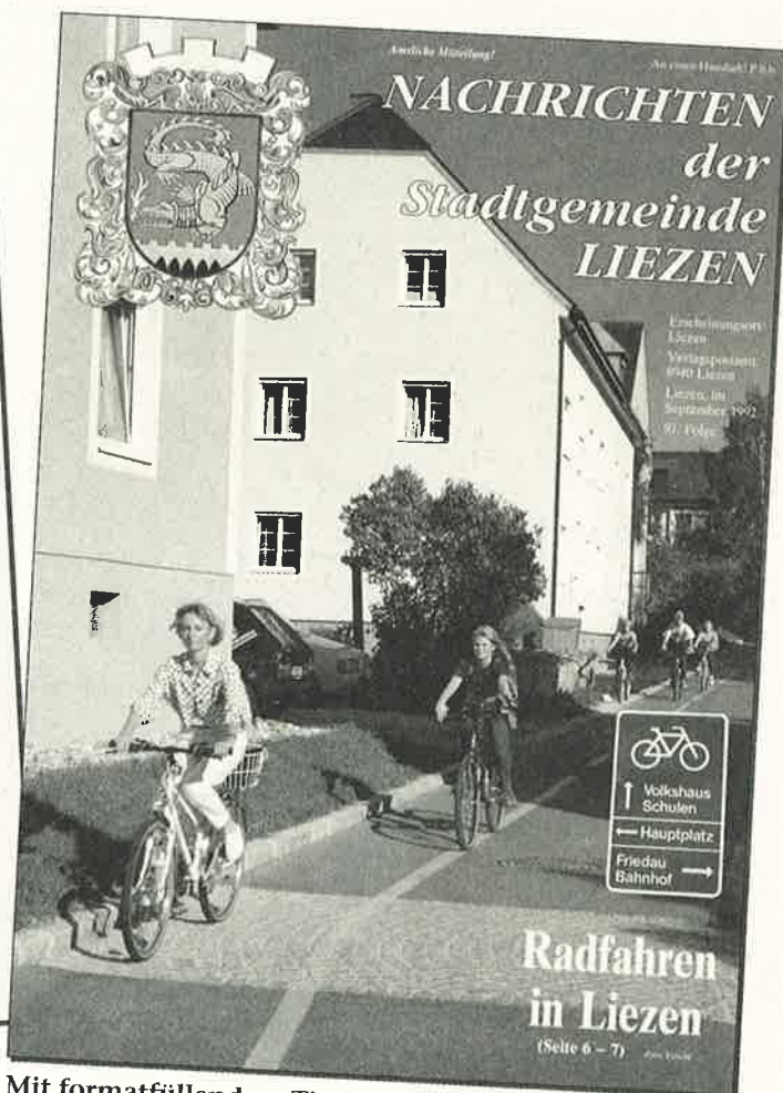
Mit formatfüllendem Titelbild ab September 1992