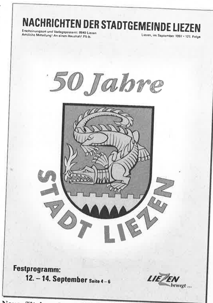
Neuer Titel zur Feier „50 Jahre Stadt Liezen“ im September 1997