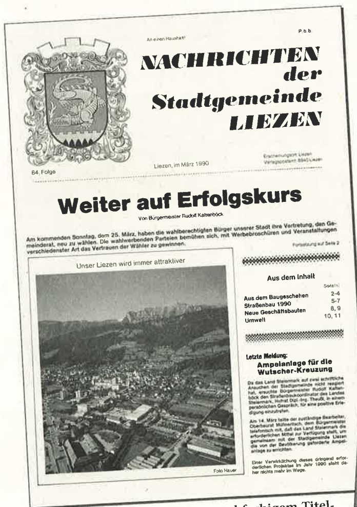
Mit modernisiertem Wappen und farbigem Titelbild im März 1990