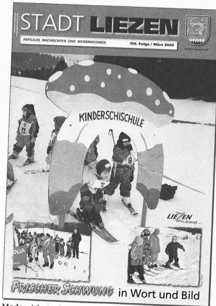
Modernisiertes Titelbild ab März 2002

Gemeinsam mit dem Stadtmarketing legte sich die Stadtgemeinde 2003 auf ein neues Erscheinungsbild in der Öffentlichkeit fest und daher musste auch die Zeitung als wichtigstes öffentliches Medium an diese Linie angepasst werden. Seit Juni 2003 zielt das dynamische Logo „STADT LIEZEN BEWEGT SICH“ die Titelseite jeder Ausgabe der Stadtnachrichten. An Beiträgen herrscht kein Mangel und so betrug der Umfang bei den letzten Ausgaben immer über 50 Seiten.