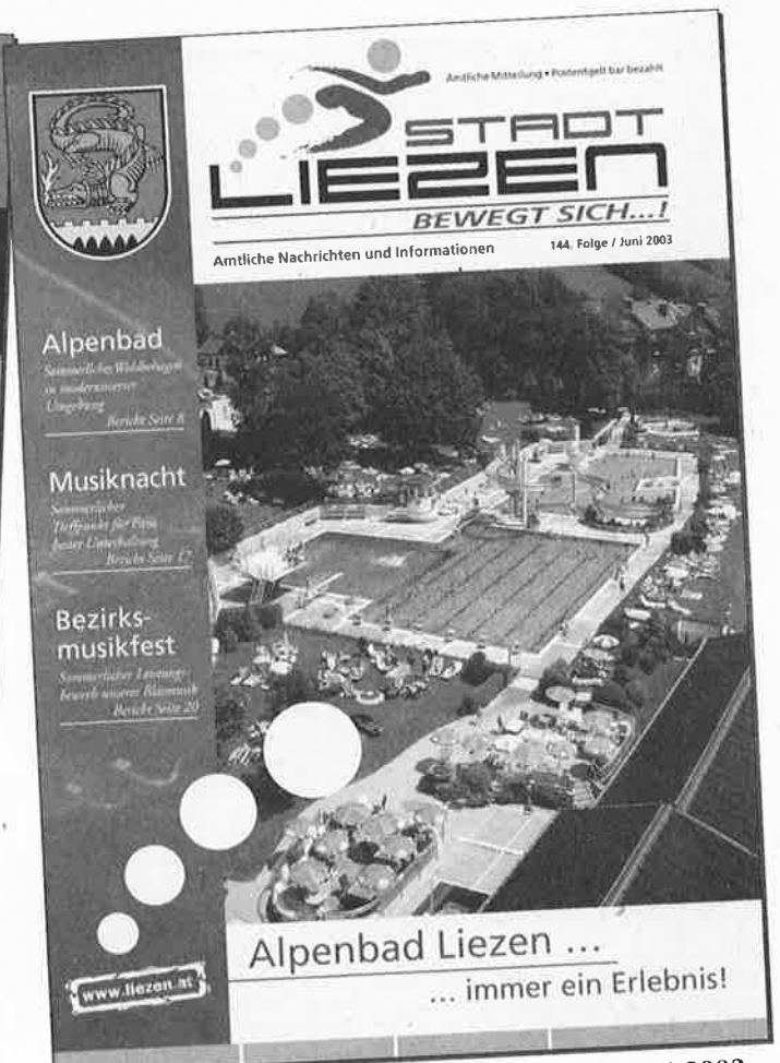
Beginn des heutigen Erscheinungsbildes im Juni 2003