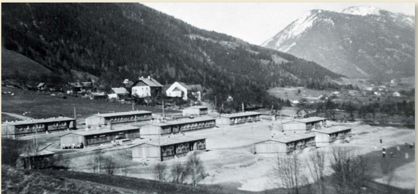
Ein beachtliches Lager war in kürzester Zeit vor dem Anwesen vlg. Zwirtners entstanden. Eine Einigung mit dem Grundbesitzer über die Nutzung des Grundes war nicht wichtig. Schließlich diente alles dem Ziel, einen Krieg siegreich zu führen.

Im Reitthal war ursprünglich ein Dreiecksgeschäft vorgesehen. Die Gemeinde sollte von Stadler vulgo Zwirtnerpachten und der RAD wäre sodann als Subpächter aufgetreten. Dazu kam es al-