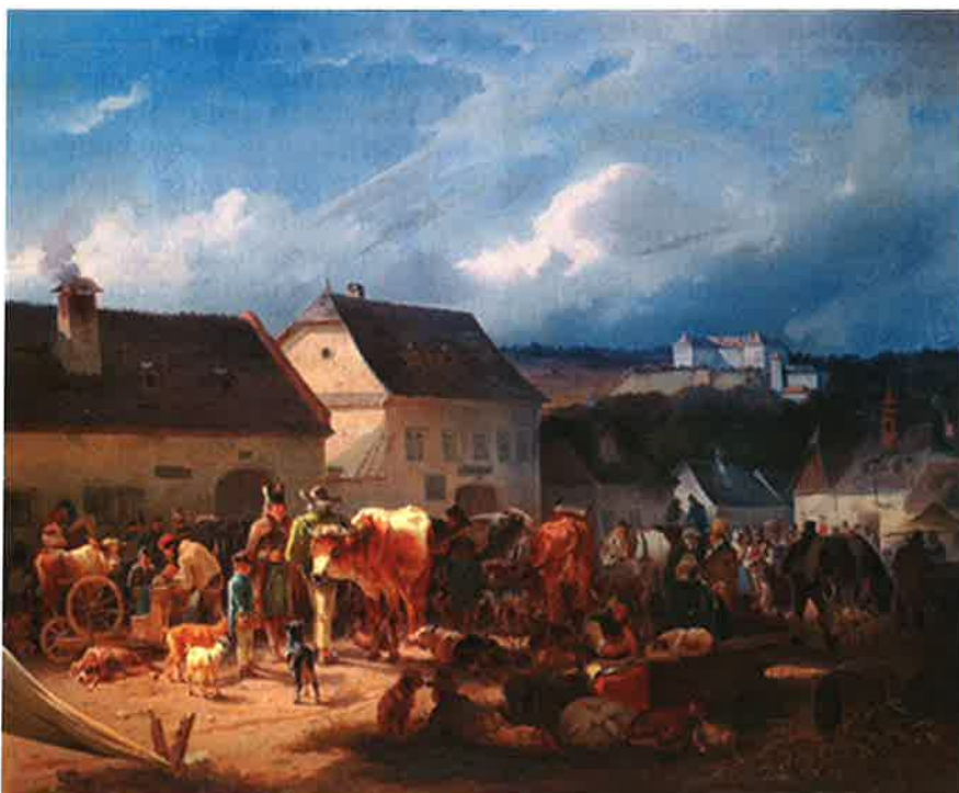
„Markttag“, Öl auf Leinwand