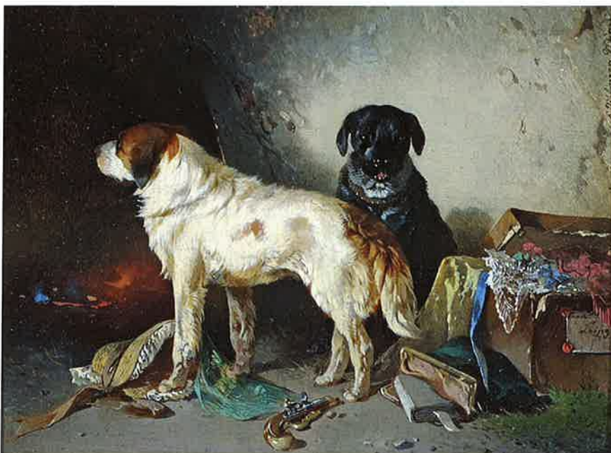
„Zwei Hunde mit Kleiderkiste“, Öl auf Holz

Als Mitglied des Wiener Künstler Vereines „Eintracht“ wurde Carl Pischinger 1861 auch Gründungsmitglied des Wiener Künstlerhauses. In den „Permanent-Ausstellungen“ des Künstlerhauses zeigte er seine Ölbilder und besuchte regelmäßig die Monats-Ausstellungen des Österreichischen Kunstvereines, sowie die Jahres-Ausstellungen in der k. k. Akademie der bildenden Künste Wien. Mehrere von Pischingers Bildern sind für die Verlosun-