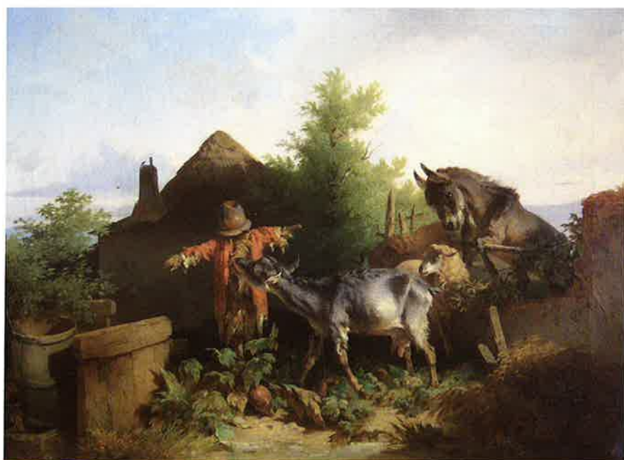
„Esel, Ziege, Schaf vor Vogelscheuche“, Öl auf Leinwand

beginnend vom 8. Mai 2011 ein Jahr lang, neben einer Friedrich-Gauermann-Dauerausstellung, die Sonderausstellung „Carl Pischinger, ein Tiermaler des Biedermeier“.