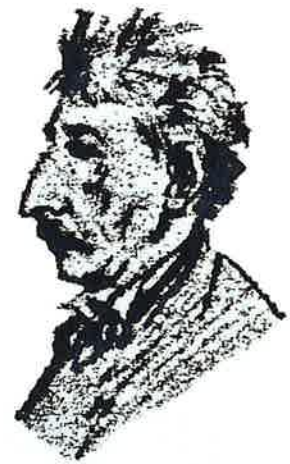
Ausschnitt aus „Kopfstudien und Selbstportrait“, Bleistift auf Papier, NÖ-Landesmuseum Wien

Sein 125. Todestag am 26. Oktober 2011 ist für den Arbeitskreis „Stadtmuseum“ Anlass, dieses bekannten Künstlers zu gedenken, sein Werk der Liezener Öffentlichkeit vorzustellen und seine Arbeiten zu würdigen.