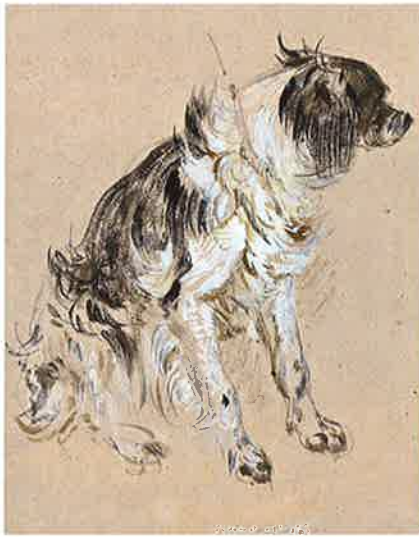
„Hund“, Grisaille auf Naturpapier