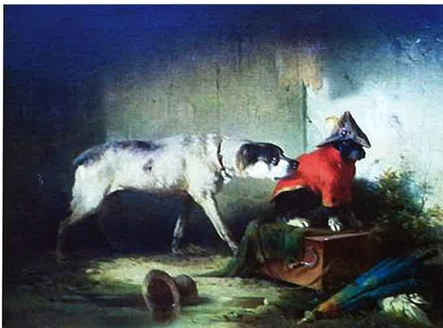
„Pensionierte Schauspieler“, Öl auf Leinwand

Seine Gemälde befinden sich heute in verschiedensten Museen, Kunstsammlungen und bei Privaten. Ein Großteil der Bleistift-, Feder-, Tusche- und Kohlezeichnungen, sowie seiner Aquarelle befindet sich in der Graphischen Sammlung „Albertina“ – Wien.