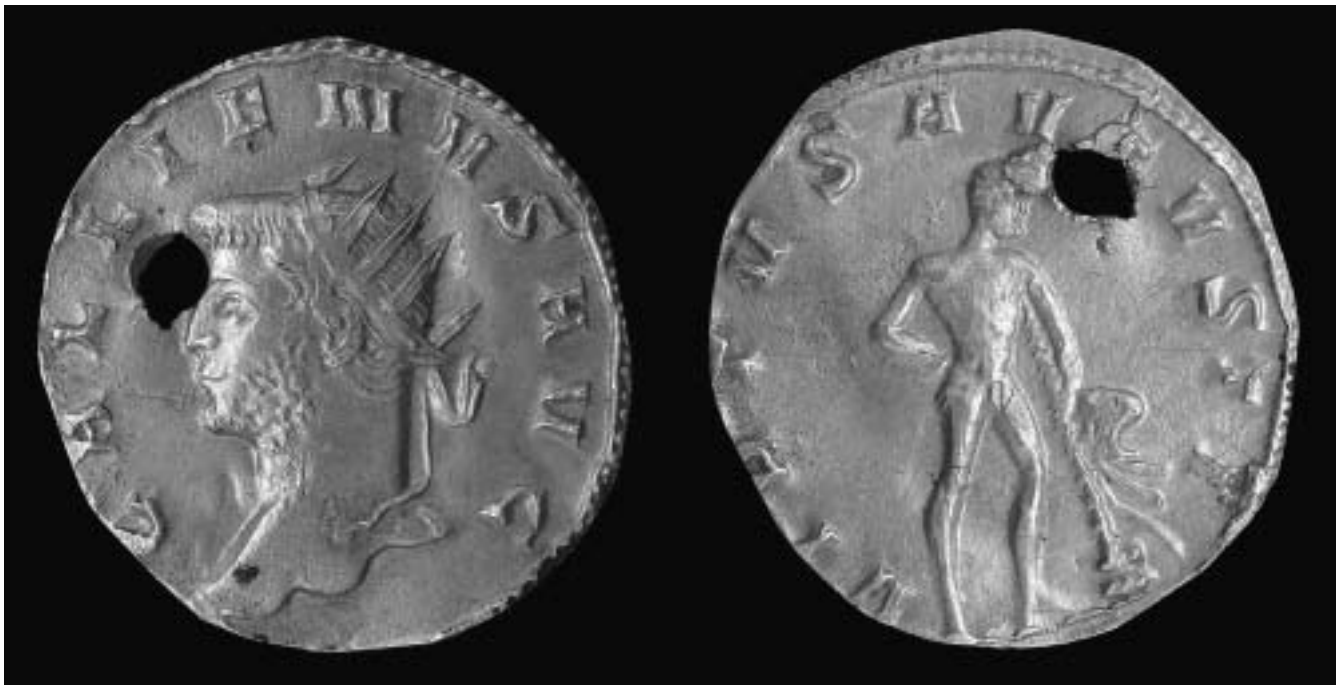
Bild 4: Römische Goldmünze, Maßstab 4:1; a) Vorderseite: Gallienus, (260–268 n. Ch.) b) Rückseite: Herkules; Fundort: Pyhrn, 1837