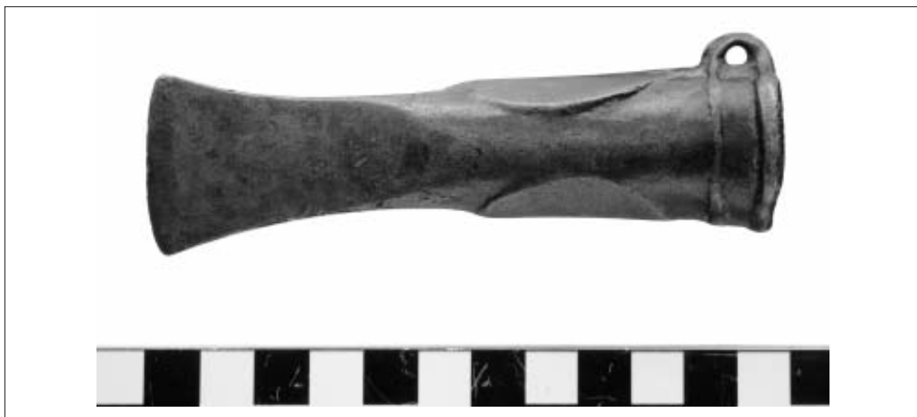
Bild 3: Bronze-Tüllenbeil, datiert: 10 Jh. v. Ch.; Fundort: Pyhrn

Ebenfalls in Eggenberg konnte im Münzkabinett die römische Goldmünze „Gallienus“ (Alleinherrschaft von 260 bis 268 n. Ch.) gesehen werden. Diese Münze wurde 1837 an der Römerstraße im Pyhrn gefunden und stellt ein Prunkstück der Ausstellung dar (Bild 4). Anzumerken ist, dass offensichtlich für das Tragen als Schmuckstück das