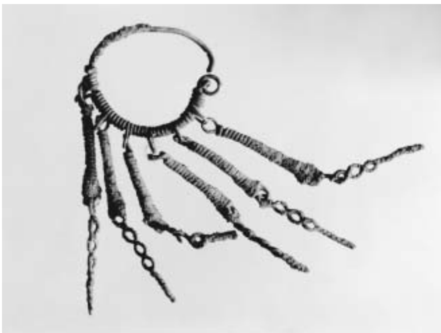
Bild 5: Ohrring mit Drahtgehängen, datiert: 9. Jh. n. Ch.; Fundort: Liezen, 1999

Während die Abgüsse bis Mitte 2011 fertig sein werden, konnte der Autor die Duplikate der drei Funde bereits am 5. 10. 2010 in Graz übernehmen und sie anlässlich des Oktober-Kulturstammtisches, der dem Thema „10 Jahre Arbeitskreis Stadtmuseum“ gewidmet war, den Interessierten in Liezen zeigen.