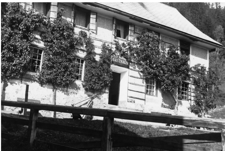
Bild 7: Beim vlg. Untersaler, dem Sommerwirthshaus zur Obstkultur (2 x Herzogin Elsa, 1 x Butterbirne, 1 x Goldrenette, 1 x Marille)

für das raue Klima herauszufinden, zeugt heute noch ein Apfelbaum im Obstgarten der Familie Dr. Domes (Fronleichnamsweg), auf dem gleich drei Sorten gedeihen (Bild 8).