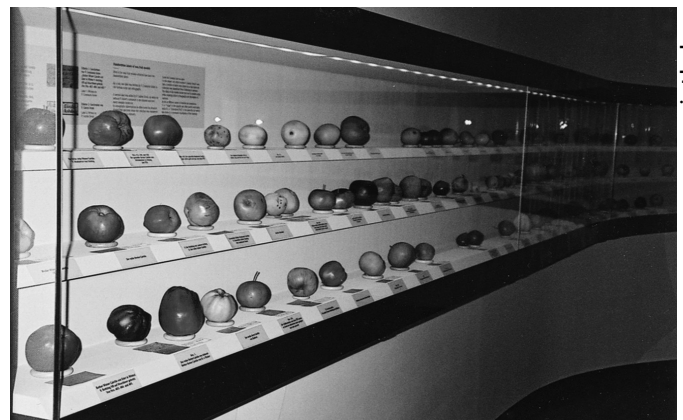
Bild 11: Modelle alter Obstsorten, im Naturhistorischen Museum des Stiftes Admont eindrucksvoll präsentiert