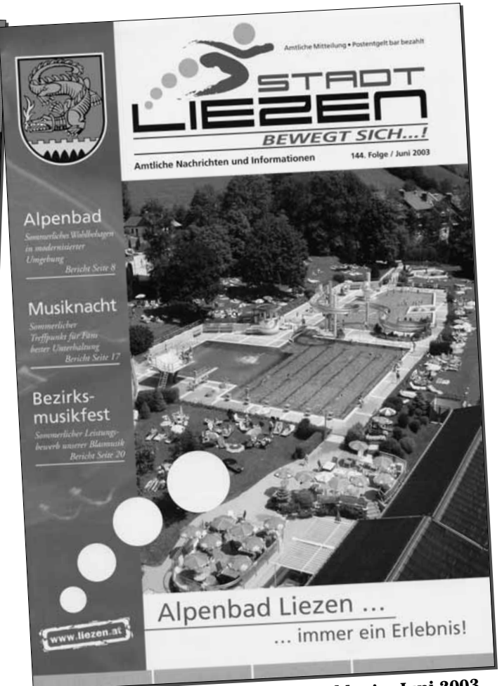
Beginn des heutigen Erscheinungsbildes im Juni 2003