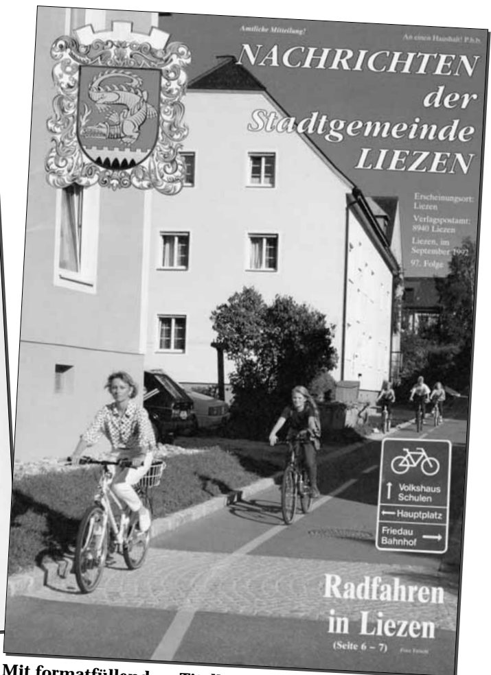
Mit formatfüllendem Titelbild ab September 1992