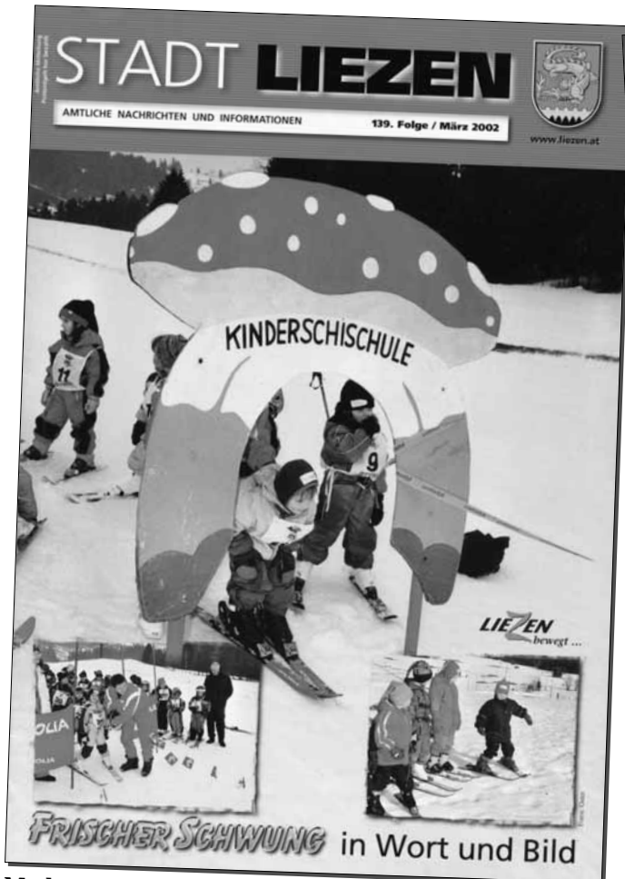
Modernisiertes Titelbild ab März 2002

Gemeinsam mit dem Stadtmarketing legte sich die Stadtgemeinde 2003 auf ein neues Erscheinungsbild in der Öffentlichkeit fest und daher musste auch die Zeitung als wichtigstes öffentliches Medium an diese Linie angepasst werden. Seit Juni 2003 zierte das dynamische Logo „STADT LIEZEN BEWEGT SICH“ die Titelseite jeder Ausgabe der Stadtnachrichten. An Beiträgen herrscht kein Mangel und so betrug der Umfang bei den letzten Ausgaben immer über 50 Seiten.