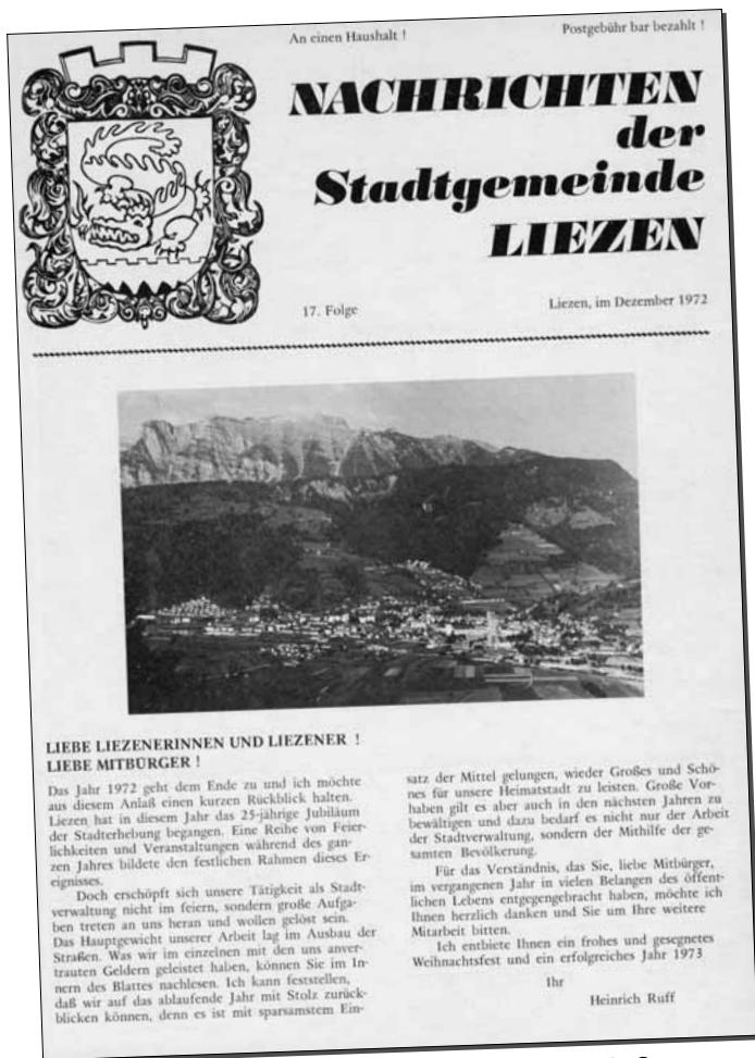
Die erste gedruckte Ausgabe im Dezember 1972