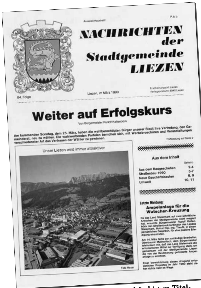
Mit modernisiertem Wappen und farbigem Titelbild im März 1990