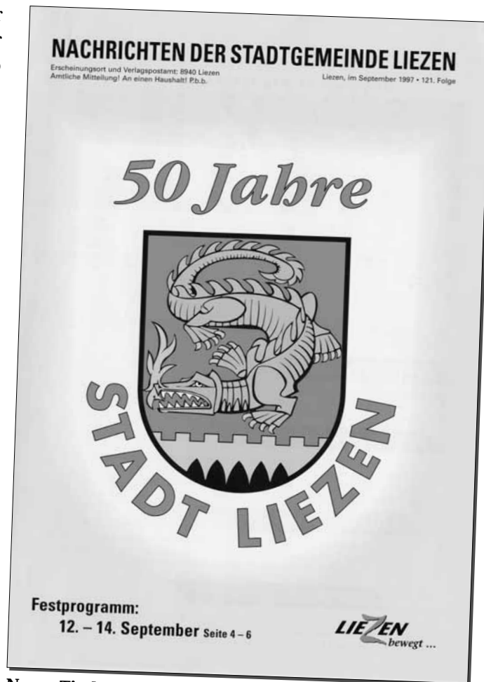
Neuer Titel zur Feier „50 Jahre Stadt Liezen“ im September 1997