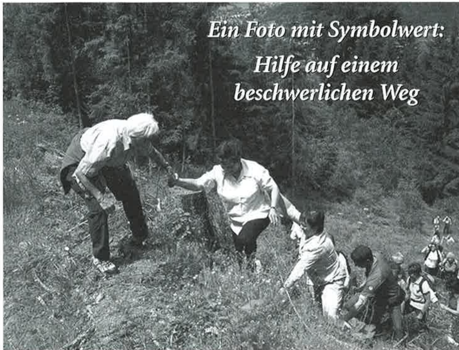
Ein Foto mit Symbolwert: Hilfe auf einem beschwerlichen Weg