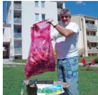
... gibt's jede Menge Müll zu entsorgen.