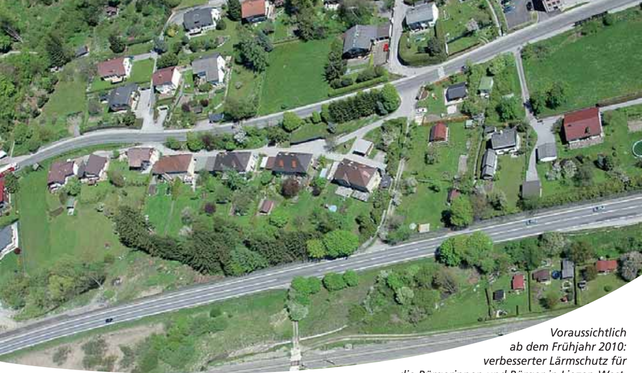
Voraussichtlich ab dem Frühjahr 2010: verbesserter Lärmschutz für die Bürgerinnen und Bürger in Liezen-West.