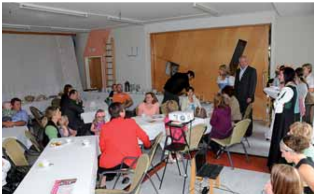
Zahlreiche Interessierte folgten der Einladung des Heilpädagogischen Kindergartens.

Anhand einer Powerpoint-Präsentation wurden den Besuchern, unter Ihnen als Ehrengast Bürgermeister Rudi Hakel,