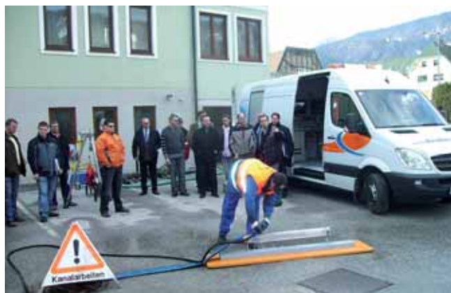
Die Stainacher Kanalreinigungsfirma Bretterebner demonstriert an einem transparenten Rohr die Wirkung verschiedener Kanalreinigungsdüsen.

lediglich als Vermittler. Sollten die verfügbaren Flächen bereits zur Verwertung an ein Maklerbüro gemeldet worden sein, würde auch die Stadtverwaltung im Falle einer Anfrage den Kontakt zum jeweiligen Immobilienbüro herstellen. Diese Sammlung von Daten sollte als Serviceleistung angeboten werden. Bitte geben Sie Ihre Daten in der Bauverwaltung der Stadt Liezen unter der Telefonnummer 03612/22 88 1 DW 112 bis 115, bekannt.