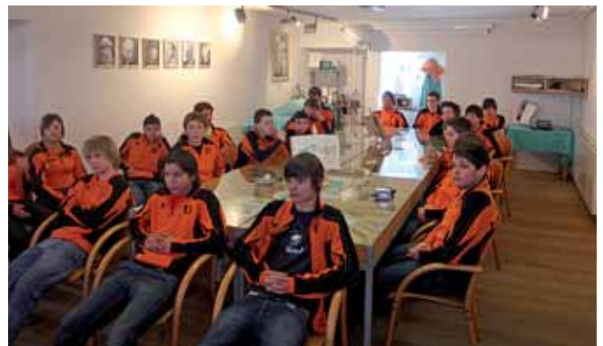
Alle SchülerInnen der 4a Sportklasse hören angespannt zu.

vollständige Entwicklung ungefähr 20 Jahre lang. Welche Konsequenzen hat regelmäßiger Alkoholkonsum für Leber und Gehirn, wenn Jugendliche immer früher zur Flasche greifen (Stichwort „Komatrinken“)? Viele Fragen der Schüler wurden beantwortet. Konnte auch nur ein Schüler davon überzeugt werden, dass Rauchen und Alkohol unseren Körper schädigen und in weiterer Folge