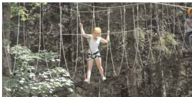
Ob auf der Seilbrücke im Abenteuerpark Gröbming, ...