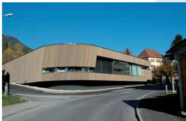
Sticht durch beeindruckende Architektur hervor: das Haus der Förderung an der Salzstraße.

Für die Planung zeichnet Architekt Reinhard Tinchon aus Graz verantwortlich. Gemeinsam mit Bauleiter Manfred Schweiberer aus Weißenbach/Liezen sorgte Tinchon für die Einhaltung des Termin- und Budgetrahmens.