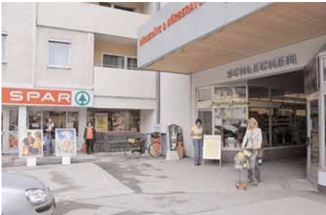
Brigittes Bioladen befindet sich gleich rechts neben dem kürzlich geschlossenen SPAR-Markt am Rathausplatz.

des täglichen Bedarfs wie Molkereiprodukte, Brot und Gebäck, Wurstwaren, Obst und Gemüse, Getränke und auf Bestellung (jeweils Freitag) auch Frischfleisch angeboten, wobei natürlich auch bei diesen Produkten auf das Prädikat „Bio“ großen Wert gelegt wird. Dass Bio nicht gleichzeitig teuer