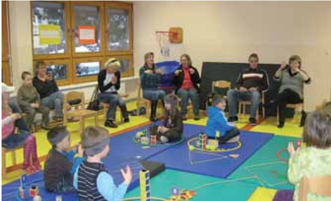
Das Zahlenlandfest im Städtischen Kindergarten sorgte für Begeisterung bei Kindern und Eltern.

Nachdem die Schulanfänger unserer Gruppe im ersten Kindergartenhalbjahr viele Erfahrungen mit den Zahlen im Zahlenraum 1 bis 10 nach dem Konzept von Professor Preiß gemacht haben, wollten Sie ihr Können auch den Eltern zeigen.