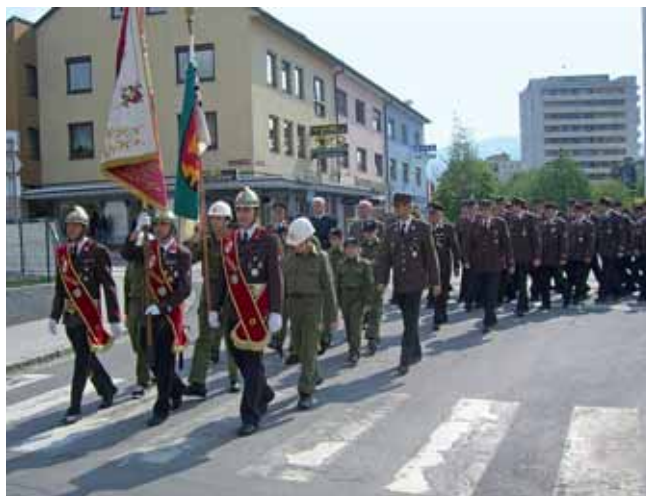
Die Freiwilligen Feuerwehren der Stadt Liezen mit den Ehrengästen beim Abmarsch in Richtung Stadtpfarrkirche.

Traditionell hielten die Freiwilligen Feuerwehren der Stadt Liezen (FF Liezen-Stadt, FF Pyhrn/Liezen und Betriebsfeuerwehr MFL) am 3. Mai ihren Florianisonntag ab, um dem Schutzpatron, dem Hl. Florian, zu gedenken.