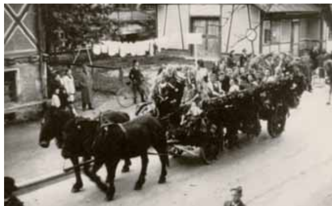
Pferde waren lange Zeit alltäglich im Liezener Stadtbild. Hier ein Bild von einem Umzug um 1950 in der Ausseer Straße. Links im Bild ein Teil des damaligen Autohauses Böhm (jetzt Irish Pub), rechts das damalige Feuerwehrhäuschen (heute Café-Restaurant Schnuderl).