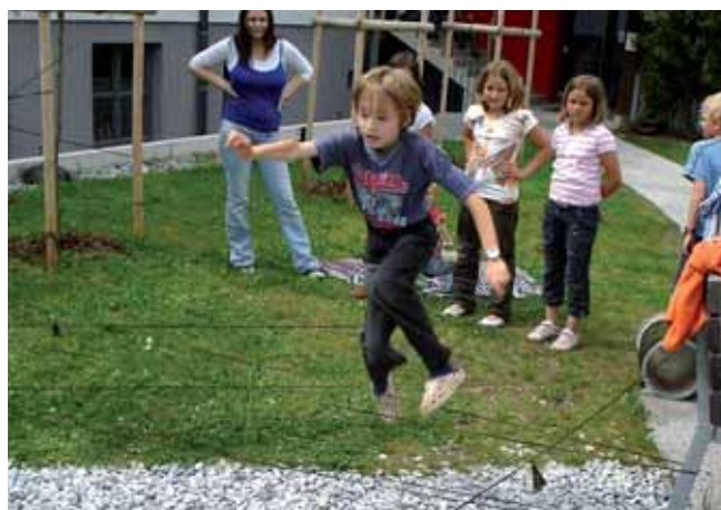
Der Nachmittag wurde von den Schülerinnen überaus abwechslungsreich gestaltet.