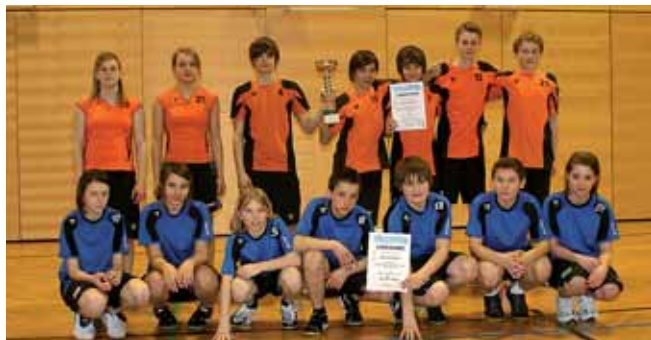
Die Teams der Hauptschule Liezen – die „Oranjes“ – gewannen das Turnier.

Rottenmann in zwei Sätzen besiegt werden, obwohl man im zweiten Satz schon 24:20 zurückerlag und dann noch 27:25 gewann.