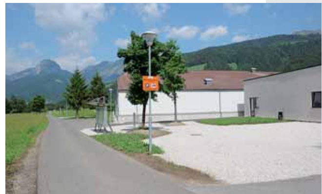
Der neue Radrastplatz und Wohnmobilabstellplatz im Sportzentrum Friedau direkt südlich des Kletterzentrums City Rock und am Ennstalradweg R7 gelegen.

Nach Abschluss der Bauarbeiten für die Kletterhalle des Alpenvereines hat die Stadtgemeinde Liezen südlich davon einen Radrastplatz sowie einen Abstellplatz für Wohnmobile errichtet.