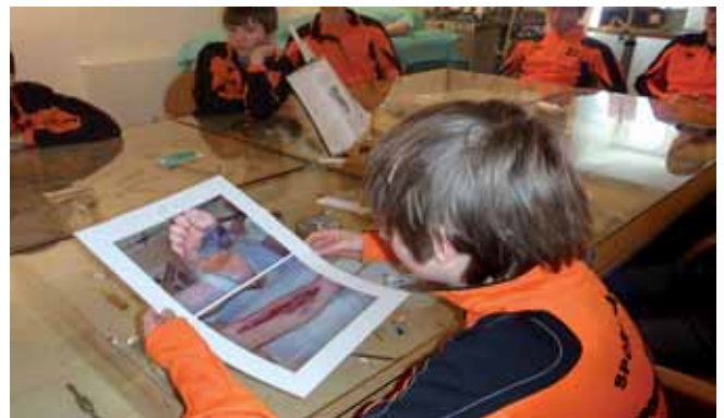
Die Bilder eines Raucherbeins machen die Schüler nachdenklich.