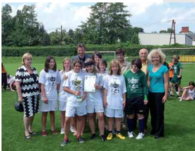
Die Mädels der Hauptschule Liezen mit Politprominenz bei der Siegerehrung.

Am nächsten Tag erreichten die SpielerInnen der HS Liezen sogar den zweiten Platz beim Finalturnier der Postliga. Mit dem Turniersieg hätte man den