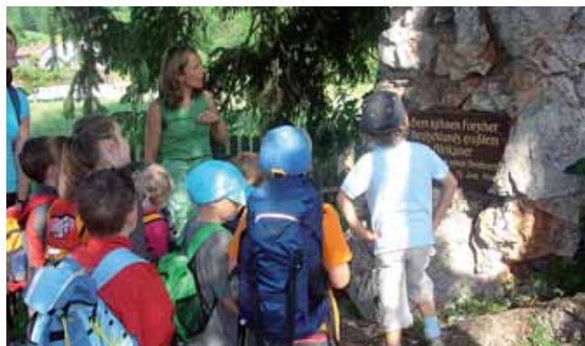
Vor dem Denkmal des berühmten Afrikaforschers lauschten die Kinder der Geschichte über Hermann von Wissmann.