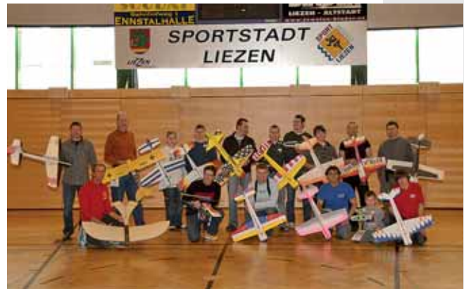
Eine interessante Variante des Modellflugsports: Indoor-Bewerb in der Liezener Ennstalhalle.

Bei diesem Bewerb geht es um das absolute fliegerische Können. Beginnend bei einer Höhe von einem Meter müssen die Piloten unter einem gespannten Band, ohne den Boden zu berühren, durchfliegen oder, um Bonuspunkte zu erreichen, dasselbe wahlweise auch im Rückenflug zu-