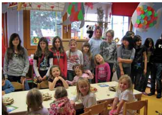
Die Kindergartenkinder lauschten aufmerksam den Osterhasengeschichten.

te fest, dass man sich schon mächtig anstrengen muss, um die Aufmerksamkeit und Kon-