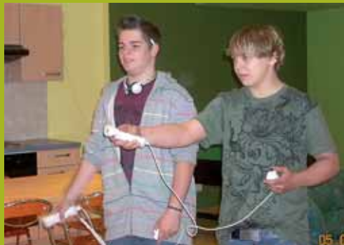
Vergleichskämpfe mit dem Wii sorgen immer wieder für Spannung.