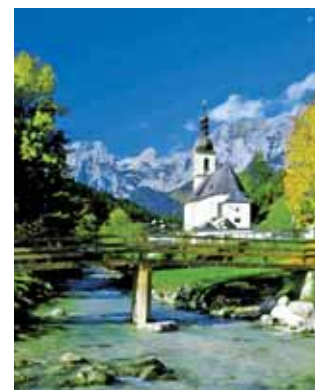
Das Ausflugsziel Ramsau am Dachstein.

Als Termin wurde Freitag, der 3. Juli 2009 festgelegt. Der Ausflug wird nach Ramsau/Dachstein und nach Michaelerberg führen. Alle Interessenten werden gebeten, sich im Bürgerservice der Stadtgemeinde Liezen anzumelden. Auf einen gemütlichen gemeinsamen Tag freut sich Stadträtin Roswitha Glashüttner. Anmeldungen bitte auch unter der Telefonnummer 03612/22881.