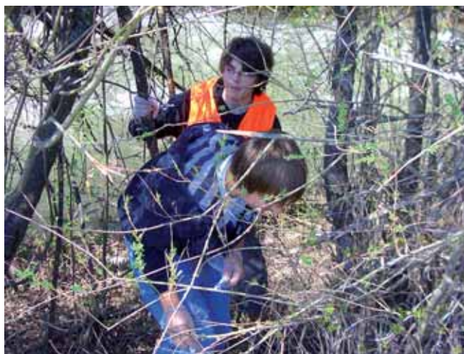
Sogar im Dickicht des Pyhrnbachufers wurden die Schülerinnen und Schüler der Hauptschule fündig.

Schüler der Realschulklasse 5 haben einen Vormittag lang das Areal rund um die Hauptschule und die sehr verunreinigte Böschung vom Pyhrnbach zwischen Werkstraße und B 320 Ennstalstraße gereinigt. Die Bilder dokumentieren die