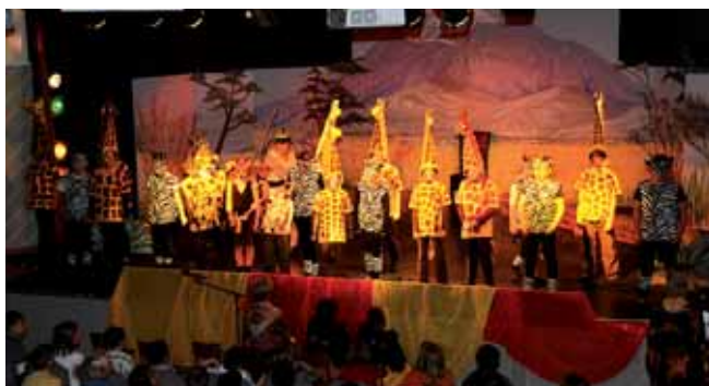
Eine wirklich bemerkenswerte Aufführung der Schüler der Volksschule Liezen. An dieser Stelle Dank und Anerkennung an die Mitwirkenden und die betreuenden Lehrerinnen.