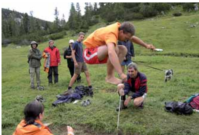
Die Veranstalter hoffen schon jetzt auf rege Teilnahme an den Bewerbungen: vor allem von Mannschaften.

Ein Jubiläum gilt es heuer auch zu feiern: Die Turnerinnen und Turner aus Eppstein in der Nähe von Frankfurt kommen be-