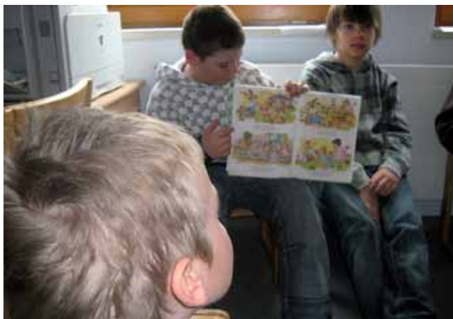
Schülerinnen und Schüler der Hauptschule Liezen präsentierten im Kindergarten lustige Geschichten.

Großen Anklang hat ein Projekt der Integrationsklasse 1b der Hauptschule Liezen mit dem Städtischen Kindergarten gefunden.