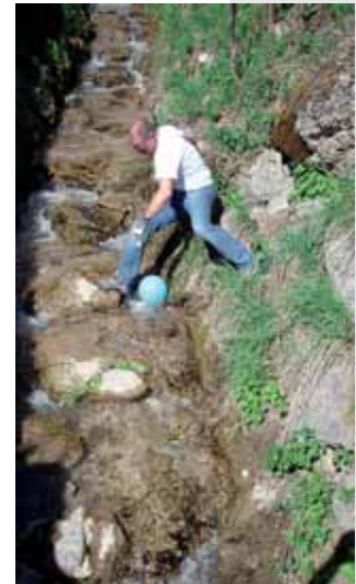
Schätze im Röthbach: Von der Styroporverpackung bis zum Luftballon

Auch wenn LIEB in den kommenden Jahren natürlich wieder an der Aktion teilnehmen wird, ergeht trotzdem ein Appell an zumindest manche unserer Mitbürger, sorgsamer mit