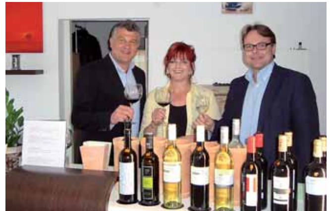
Von Experten empfohlen: Ab sofort gibt es bei Autoteile Christa auch ausgewählte Weine und erstklassiges Olivenöl.