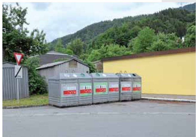
Auch beim Städtischen Bauhof in der Ausseer Straße war der Anblick wie auf dem linken Foto fast schon alltäglich. Im Zuge der Änderung des Entsorgungssystems sind nur mehr die Altglascontainer auf diesem Standort verblieben, die Verunreinigungen bleiben aus.