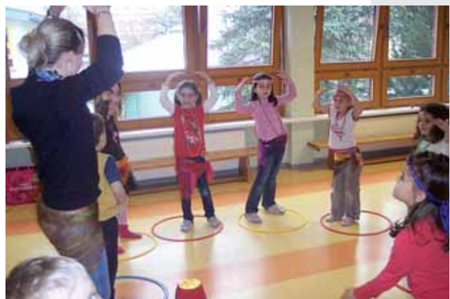
Früh übt sich, wer eine Bauchtänzerin werden will.