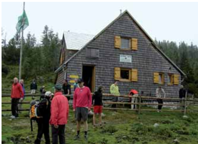
Die Hochalm um die Liezener Hütte wird im Sommer wieder zum Austragungsort des Bergturnfestes.

am 1. Sonntag im August, also am 2.8.2009, stattfinden. Nach der Begrüßung der Teilnehmer um 9.30 Uhr werden im Anschluss die Bewerbe wie Schleuderball, Keulenwerfen, 100 m-Lauf, Kugelstoßen usw. sowie die Kinder-, Jugend- und Mehrkampfbewerbe ausgetragen.