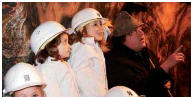
... bei der Schatzsuche im Salzbergwerk Altaussee ...