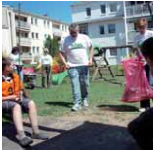
Am Spielplatz am Brunnfeld ...

dem Gut „Umwelt“ umzugehen. Lieber mal kurz nachdenken und einen Mistkübel ansteuern, als etwas an Ort und Stelle fallen lassen und meinen, „na irgendjemand wird meinen Mist schon wegräumen!“