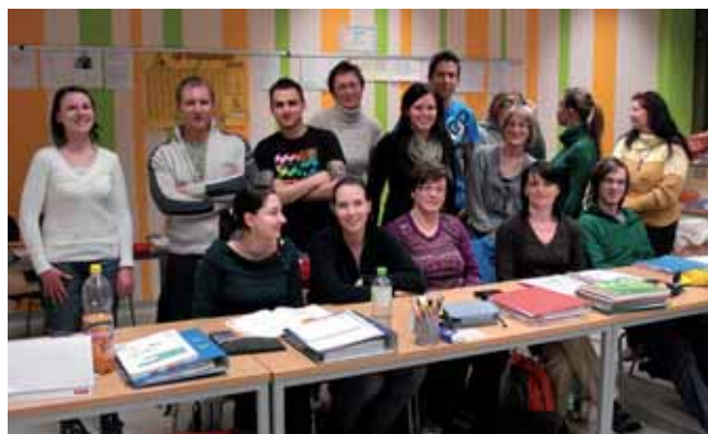
Ein HAK-Abschluss bringt ausgezeichnete Chancen im Beruf.

Einen Informationsfolder finden Sie im Internet unter unserer Internetadresse www.bhak-liezen.stsnet.at unter „Infos zur Abend-HAK“ und einen Anmeldebogen unter „Zum Anmeldeformular“. Für weitere Informationen steht Ihnen gerne