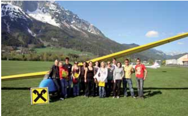
Der Flugschnuppertag ging bei Traumwetter über die Bühne.

Ende April 2009 organisierte die Raiffeisenbank Liezen in Zusammenarbeit mit der Union Sportfliegerclub Wörschach-Niederöblarn und der Alpenflugschule Niederöblarn zum dritten Mal den Flugschnuppertag für Jugendliche.