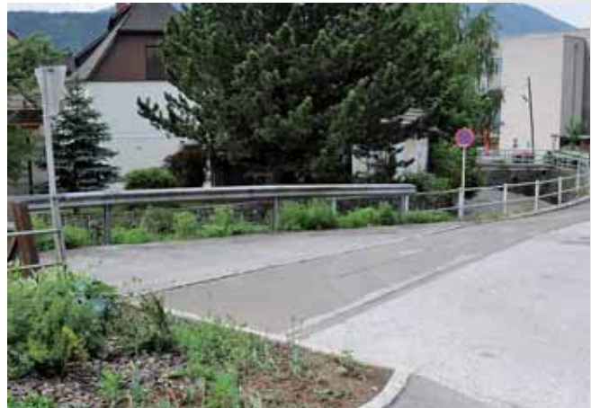
Die Abfallsammelstelle beim Erzherzog-Johann-Park war einer der auslösenden Gründe für die unbedingt erforderliche Neuorganisation der Müllsammlung. Das diesem Projekt der Erfolg beschieden ist, zeigen diese beiden Fotos in eindrucksvoller Weise.