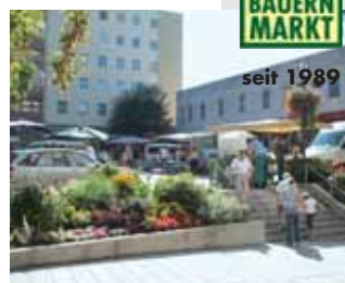
Jeden Donnerstag: Bauernmarkt am Marktplatz.

Veranstaltungskalender des Golf- & Landclubs Ennstal Weißenbach-Lassing-Liezen unter www.glcennstal.at Bitte geben Sie Ihre Veranstaltungen für eine Veröffentlichung in STADT LIEZEN zeitgerecht beim Bürgerservice der Stadt Liezen, Tel. 03612/22881-0 oder bei Stadtmarketing & Tourismus Liezen, Tel. 03612/25658, bekannt! Eine Übersicht über sämtliche Veranstaltungen der Stadt Liezen finden Sie auch im Internet unter www.liezen.at · Terminänderungen vorbehalten!