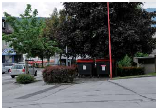
Auch kleinere Sammelstellen, wie jene beim Vorplatz der Freiwilligen Feuerwehr an der Döllacher Straße, wurden neu organisiert. Vor allem durch die Einführung der Gelben Tonne und die Verbesserung des Systems mit der Entsorgung durch den Gelben Sack gibt es kaum mehr Beeinträchtigungen.