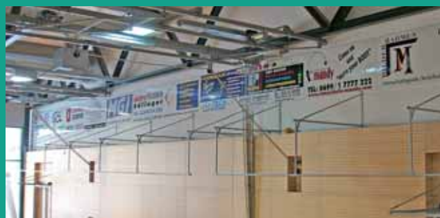
Attraktive Werbemöglichkeiten in der Ennstalhalle.

Die Freizeitbetriebe der Stadt Liezen GmbH vermietet in der Ennstalhalle Werbeflächen. Die Miete beträgt pro Laufmeter und Jahr € 75,- zzgl. MWSt. und Werbeabgabe.