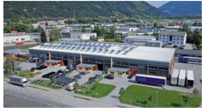
Die größte Photovoltaikanlage der Steiermark auf einem Dach wurde im Wirtschaftspark Liezen installiert.

Damit werden CO 2 -Emissionen in der Größenordnung von 41.000 kg/Jahr vermieden.