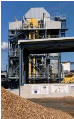
Unter anderem das Biomassekraftwerk sorgt für die Energieunabhängigkeit der Stadt Güssing.

Aus dem „armen südburgenländischen Nest“ ohne wirtschaftliche Perspektiven ist eine florierende Gemeinde geworden, deren Biomassekraftwerk von Experten aus aller Welt bestaunt wird.