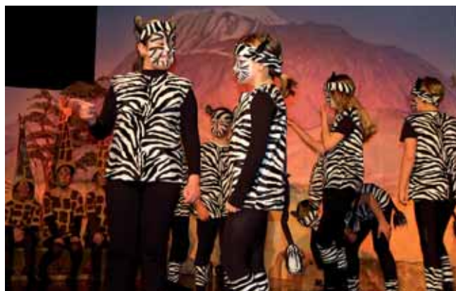
Die Kinder zeigten schauspielerische und gesangliche Leistungen der Spitzenklasse.

der „afrikanische Chor“ - sie alle begeisterten das Publikum mit ihrem schauspielerischen Können, der Klarheit im Ausdruck und den musikalischen Fähigkeiten. Der Reinerlös dieser Aufführungen sowie verschiedener Aktivitäten einzelner Klassen (Buffet nach dem Musical-Abend, Verkauf von Basteleien, Projektvorstellungen, usw.) kommt der ABC-Aktion zugute. Den Abschluss findet dieses Jahresprojekt im Juni mit der Überreichung des Schecks. Dann haben wir auch in Zahlen die Gewissheit, dass der Einsatz sich gelohnt hat. Eine CD über die Musicalaufführung ist in der Direktion der Volksschule, im Bürgerservice und im Spieleparadies in der ARKADE um 12 Euro erhältlich. Der gesamte Reingewinn kommt ebenfalls der Organisation „Brücke in den Congo“ zu Gute.