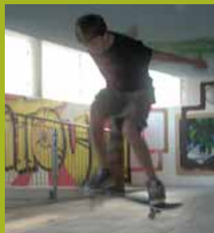
Der überdachte Freiplatz vor dem YOUZ lädt zum Skaten ein.

2006 beim Verein Avalon, vorher Notschlafstelle Liezen, 2 Jahre Karenz und seit April 09 Jugendzentrum, Ausbildung: Behindertenpädagogik) und Astrid Oberegger (Alter: 25, seit Jänner 2006 im Jugendzentrum, Ausbildung: Studium