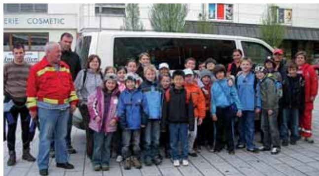
Die Wasserrettung Liezen mit den Schülerinnen und Schülern der Volksschule Liezen.

der Kinder. Bei allem Spaß war aber auch die Betroffenheit der Kinder über so manche Müllsünde groß: So wurden zum Beispiel eine alte Autobatterie und ein Einkaufswagen gefunden und ordnungsgemäß entsorgt.