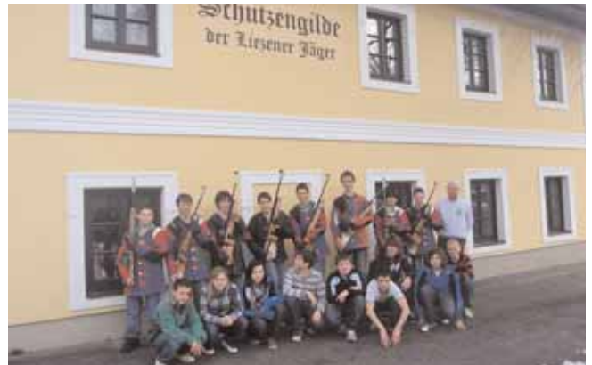
Die jungen Sportschützen der Hauptschule Liezen.

Hauptaugenmerk galt aber dem Thema „Rauchen und Alkohol“. Was Rauchinhaltsstoffe in der Lunge und in den Blutgefäßen anrichten, wurde eindrucksvoll anhand von Bildern und anderen Anschauungsmaterialien demonstriert. Ein Honigglas voll Teer lagert sich in unsere Lunge ab, wenn man nur ein Jahr lang täglich 30 Zigaretten raucht. Was bewirken die Rauchinhaltsstoffe in den Blutgefäßen des Herzens, wenn man bedenkt, dass das Einstiegsalter für Raucher momentan bei einem Alter von 11,8 Jahren liegt? Unser Gehirn braucht für seine