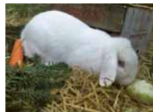
... Loona ...

Die neuen Gnadenhoftiere würden sich über Paten übrigens sehr freuen, aber auch mit