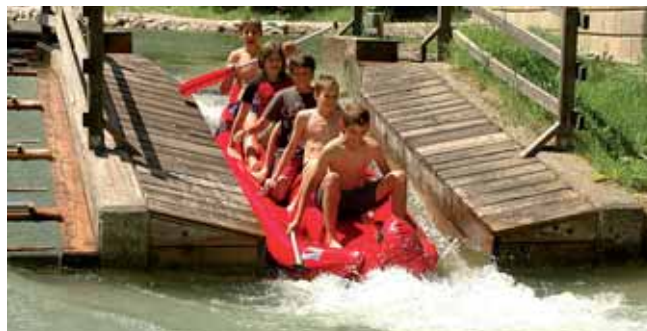
... oder im Wasserspielpark: Juppidu macht einfach Spaß!