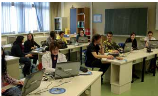
Modernst ausgestattete EDV-Schulungsräume garantieren Lernerfolg.

Handelsakademie sind grundsätzlich für höhere Tätigkeiten in allen Bereichen der Wirtschaft und Verwaltung qualifiziert, was bei der Suche