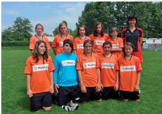
Steirischer Vizemeister: Mädchen Fußball 2009 der Hauptschule Liezen.

Einzug zum Österreichfinale in St. Pölten erreicht. Die Postliga für Mädchenfußball wird in Zukunft das Gegenstück zu der Schülerliga Fußball der Burschen sein.