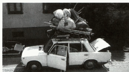
Aufgrund massiver Beschwerden aus der Bevölkerung müssen solche Bilder in der Stadt Liezen der Vergangenheit angehören.

Bei dieser Variante würden unter Aufsicht an höchstens 10 Standorten im Stadtgebiet einmal im Jahr an einem Tag