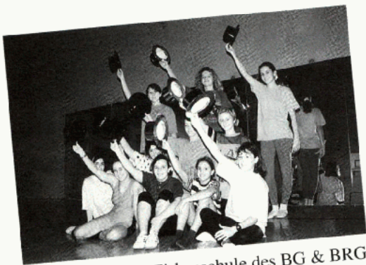
Die Jazzdance & Zirkusschule des BG & BRG Stainach (Foto oben) und das Swing & Musicalorchester des Stiftsgymnasium Admont sorgen beim Hauptplatz-Fest am Samstag für die Tanz- und Musikeinlagen