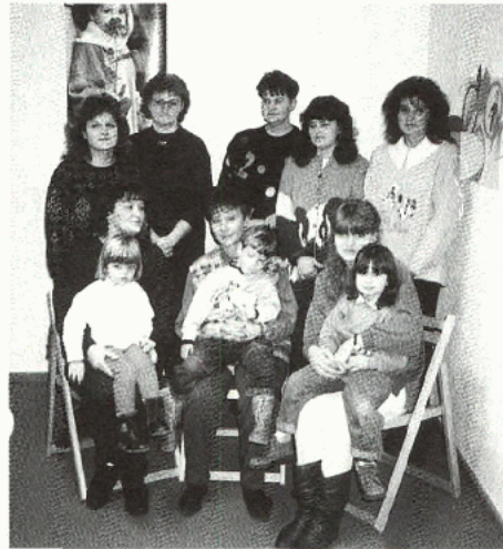
Die Tagesmütter der Lebenshilfe Liezen

Interessenten an einer Tagesmutter wenden sich an den Verein „Volkshilfe“, 8940 Liezen, Ausseer Straße 29, Tel.: 03612/25 5 90