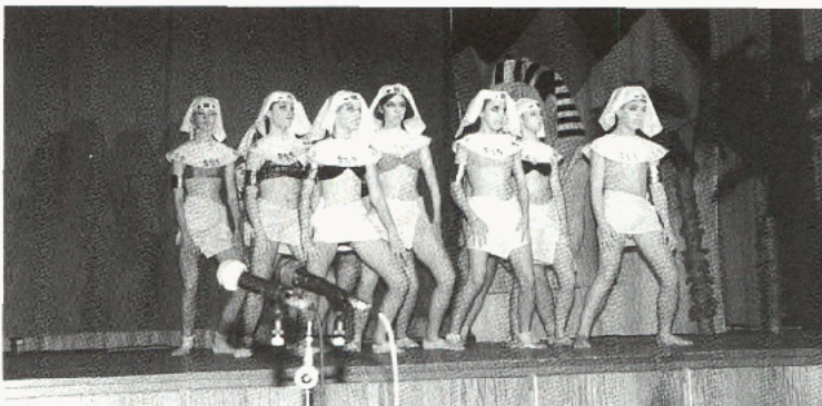
Auch bei den alten Pharaonen in Ägypten wurde getanzt.

Schüler des BG/BRG Stainach gastieren mit ihrer Tanzaufführung am Donnerstag, dem 20. Jänner 1994, um 19.30 Uhr im Liezener Kulturhaus