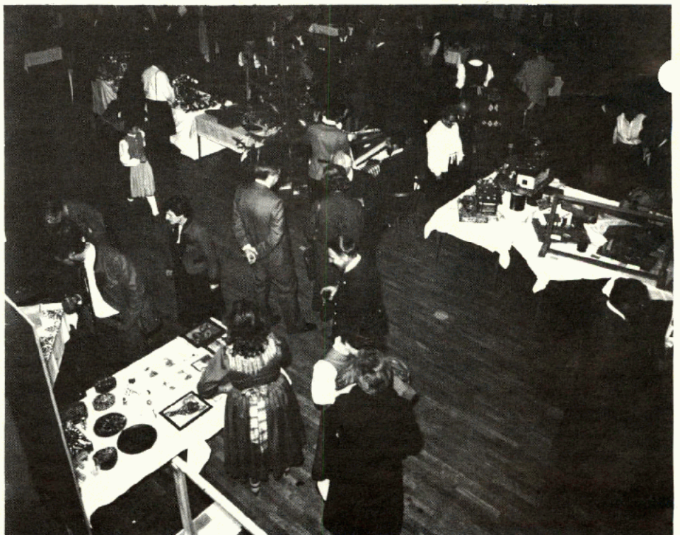
Die Weihnachtsausstellung 1984 war ein großer Erfolg

Eröffnet wird die Ausstellung am Freitag, dem 22. November 1985, um 19.30 Uhr. Der Eintritt zur Ausstellung ist selbstverständlich kostenlos.