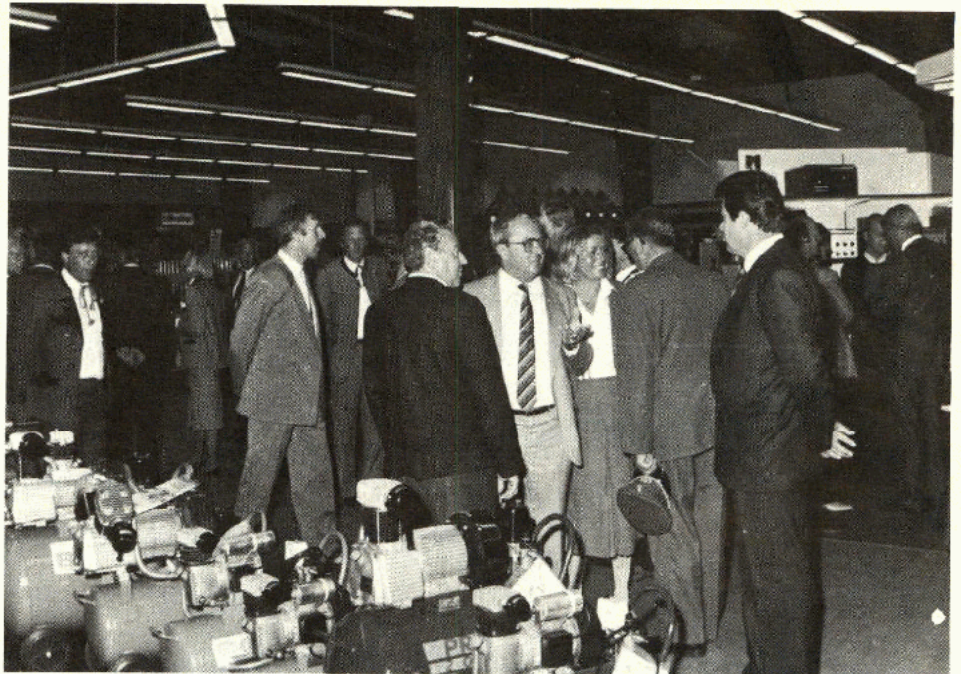
Die Vergrößerung der Eisenhof-Anlagen geht weiter. Die Verkaufsfläche wurde von 7000 auf 10.000 m 2 ausgedehnt. Wie man hörte, wird als nächstes Projekt der Großhandel auf ein eigenes Areal verlegt. Außergewöhnlich viele Gäste gaben dem angesehenen Unternehmen der Eröffnung die Ehre der Anwesenheit.

Doch die Stadt des Einkaufszentrums Liezen steht vor zwei noch weiterreichenden Großinvestitionen. Die ADEG will am Ostrand in der Gesäusestraße ihren Betrieb ändern, erweitern und durch „eingemietete“ Fremdfirmen zu einem eigenen „Einkaufszentrum“ aufwerten. Meint man strebt ein weiteres „Einkaufszentrum“ in Form einer PAM-PAM-Filiale auf der aufgeschütteten Grundfläche an der Westeinfahrt der Stadt an. Die beiden zusätzlichen Einkaufszentren im Einkaufszentrum Liezen würden allein wieder 9000 Quadratmeter Verkaufsfläche bringen.