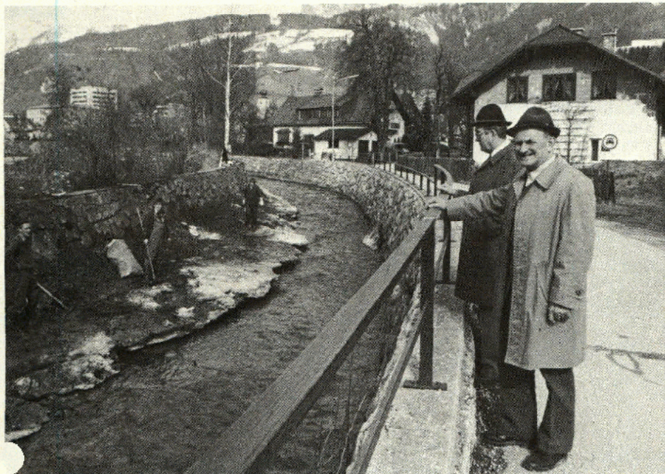
Die Säuberung des Pyhrnbaches und anderer Gerinne mobilisiert zusätzliche Arbeitskräfte für zusätzliche Arbeiten (Aktion 8000)