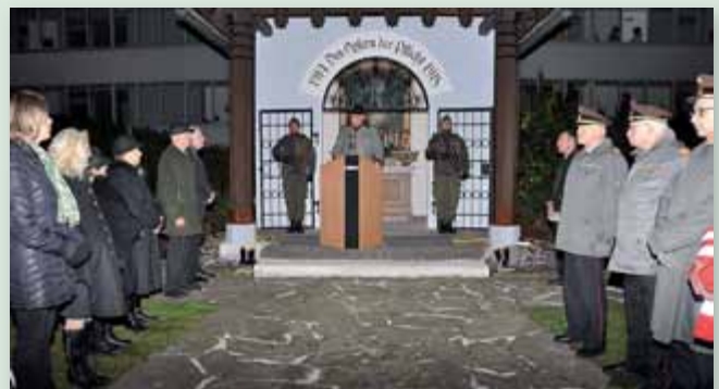
Am Dienstag, den 31. Oktober fand traditionell die Gefallenenehrung des Kameradschaftsbundes Liezen beim neu renovierten Kriegerdenkmal in der Ausseer Straße statt.