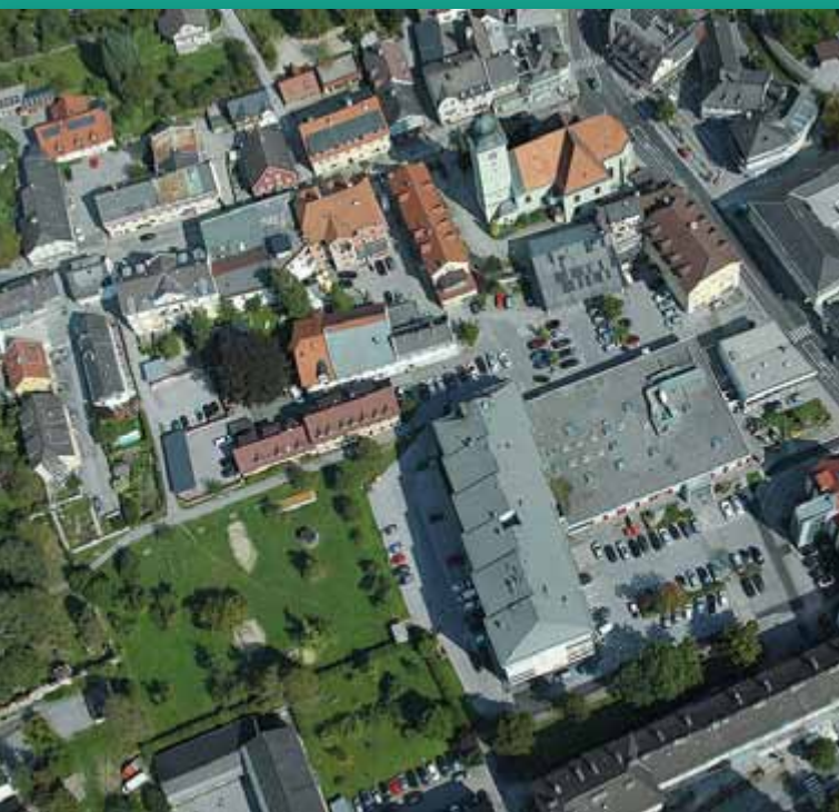
Das innere Kerngebiet der Stadt Liezen aus der Luft betrachtet.

Transportkosten von Sachgütern nach Albanien. Zu ihrem bunten Kundenstock zählen Menschen aus Liezen, die gerne schöne, preisgünstige Stücke erstehen und darüber hinaus etwas Gutes tun möchten. Ein positiver Effekt des Ladens ist, dass sich Einheimische und verschiedene andere Kulturen in dem kleinen Geschäft näherkommen.