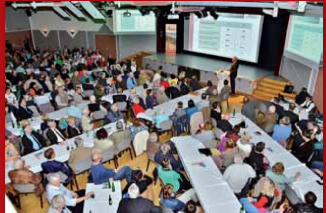
Die Bürgerversammlung für die Vorstellung des neuen Flächenwidmungsplanes findet am Dienstag, den 12. Dezember 2017 mit dem Beginn um 19.00 Uhr im großen Kulturhaussaal statt.

So verbleibt ein ohnehin immer als solcher nutzbarer Teil des Eisenhof-Grundstückes als Fläche für Einkaufszentren 2 (ohne Lebensmittel) bestehen, die verbleibenden Grundstücke der Liegenschaft Eisenhof und die gesamte verbleibende Handelszone Ost bis zum Kreisverkehr bei Bellaflora sollen im Sinne einer zukunftsweisenden Stadtentwicklung als Gewerbegebiet ausgewiesen werden.