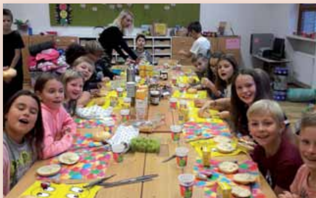
Nach der „coolen“ Lesenacht wurde noch gemeinsam mit den Eltern gefrühstückt.

benutzten. Denn wie der Name „Lesenacht“ schon sagt, durften wir nun etwas in unseren Büchern schmökern. Als wir eine Zeit lang gelesen hatten, machten wir uns schlaffertig. Nachdem wir es uns schon alle in unseren Schlafsäcken gemütlich gemacht hatten, schauten wir uns noch einen Film an. Nach dem Film waren wir alle schon müde und schliefen ein. Am nächsten Tag wachten wir schon früh auf.