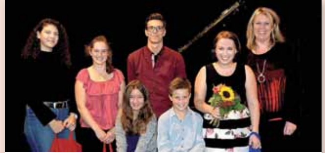
Das Erlernen eines Instruments fördert bei Kindern auch die Konzentration und Kommunikation.