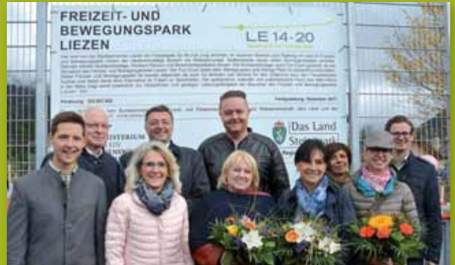
Am 21. September ist der Freizeit- und Bewegungspark offiziell eröffnet worden.

allen in den Herbstwochen – wenn es früh dunkel wird, zeigen sich die Vorteile, die sich durch die Beleuchtung bieten. Eine Nutzung bis in die frühen Abendstunden wird dadurch möglich.