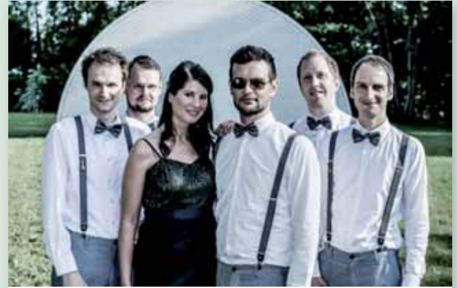
Die Grazer Band „High five“ wird beim Stadtball Liezen 2018 für Stimmung sorgen.

Am Samstag, den 20. Jänner 2018 findet wieder der große Liezener Stadtball, veranstaltet von der SPÖ Liezen, im Kulturhaussaal statt. Für den besonderen musikalischen Genuss und sehr zur Freude aller Tänzer konnten für die „2018er“-Ausgabe „High Five“ organisiert