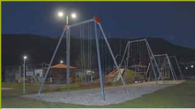
Um beim Beleuchtungskonzept Energie zu sparen, setzt die Gemeinde auf Solarleuchten.

Für heuer wird der Bewegungspark wohl viel zu kurz zum Einsatz kommen. Schließlich rückt der Winter mit großen Schritten näher. Davor – vor