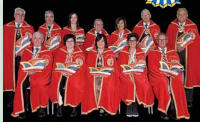
Die Faschingsgilde freut sich über Ihren Besuch bei den Liezener Narrenabenden 2018.

■ Weitere Informationen gibt es auch auf der Homepage der Faschingsgilde zu Liezen unter www.faschingsgilde-liezen.at .