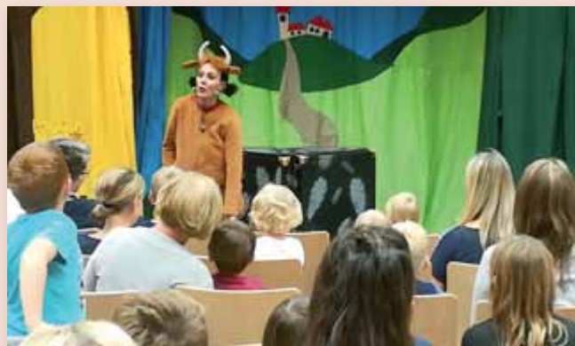
Einen ganzen Saal voller Kinder begeisterte das Quasi Quasar Theater mit dem Stück „Mama Muh und die Krähe“.