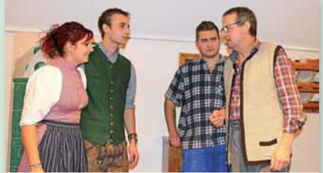
Jedes Jahr ein Highlight – das Theaterwochenende in Weißenbach.