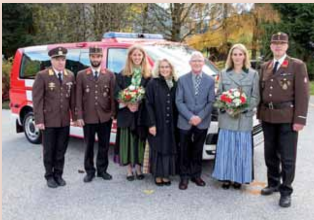
Die Segnung des neuen Mannschaftstransportfahrzeuges.

Am Samstag, dem 28. Oktober 2017 fand beim Rüsthaus der Feuerwehr Pyhrn die feierliche Weihe des neuen Einsatzfahrzeuges „MTFA“ – Mannschaftstransportfahrzeug statt.