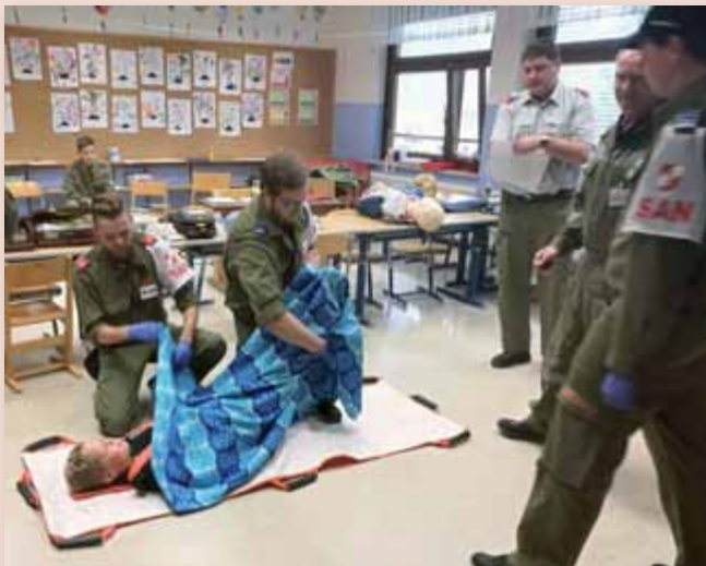
Die Feuerwehr Liezen bei der Sanitätsleistungsprüfung.

Stadt sowie 2 Mann der FF Pyhrn nahmen an der Sanitätsleistungsprüfung teil und legten die Stufen I (Bronze) und III (Gold) erfolgreich ab. Viele Übungsstunden der Feuerwehrsanitäts-Trupps waren nötig, um bestens für diese Leistungsprüfung vorbereitet zu sein. Bestehend aus drei Stationen (Theoretische Prüfung, Einzelaufgabe, Gruppenaufgabe) soll diese Leistungsprüfung