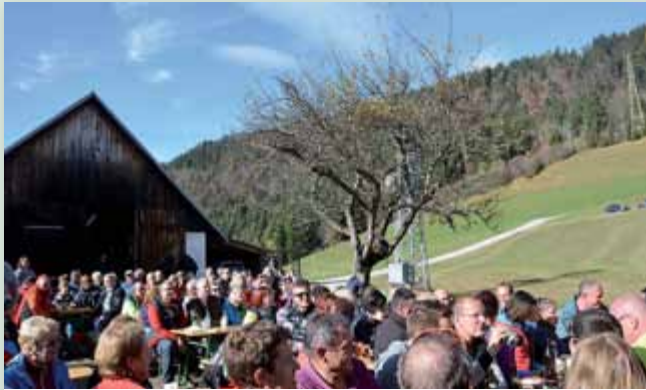
Belohnt mit traumhaftem Herbstwetter unterhielten sich alle Wanderer prächtig bei Speis, Trank und zünftiger Musik.

Im Rahmen des 9. Bürgermeisterwandertages marschierten am Nationalfeiertag vier Gruppen auf vier unterschiedlichen Wanderrouten Richtung Schlagerbauer. Der Tourismusverein Weißenbach legte vom Dorfplatz los, während in Liezen