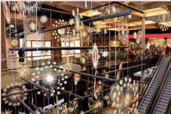
Strohsterne zieren das weihnachtliche ELI Einkaufszentrum.

Advent – die vorweihnachtlichen Tage, um Erledigungen und Vorbereitungen für das große Fest zu treffen.