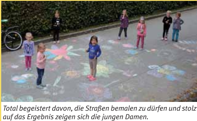
Total begeistert davon, die Straßen bemalen zu dürfen und stolz auf das Ergebnis zeigen sich die jungen Damen.

... diese Aktion des Umweltreferates zur Europäischen Mobilitätswoche