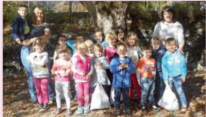
Fröhlich präsentieren die Kinder ihre vollgefüllten Säckchen.

Der große Kastanienbaum war für die Kinder faszinierend. Mit vollgefüllten Taschen ging es wieder zurück in den Kindergarten. Dort konnten die Kastanien in allen Bildungsbereichen eingesetzt werden.