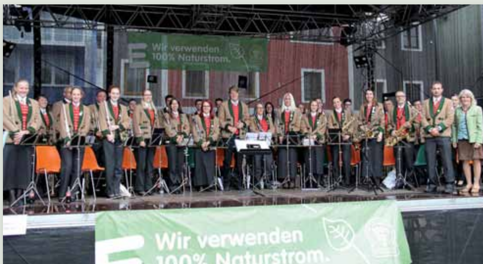
Dieses Bild entstand im Rahmen der Mid Europe 2017 in Schladming.

Wir – der Musikverein Weißenbach – bedanken uns herzlichst bei allen, die uns auch im heurigen Jahr wieder so erst-