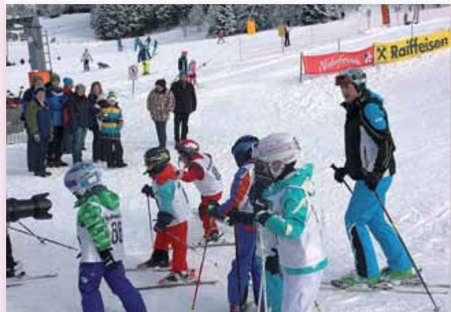
Anfang Jänner 2018: Kinderschikurs auf der Kaiserau.

Auskunft und Anmeldungen bis 21. Dezember unter der Telefonnummer 0676/52 96 256.