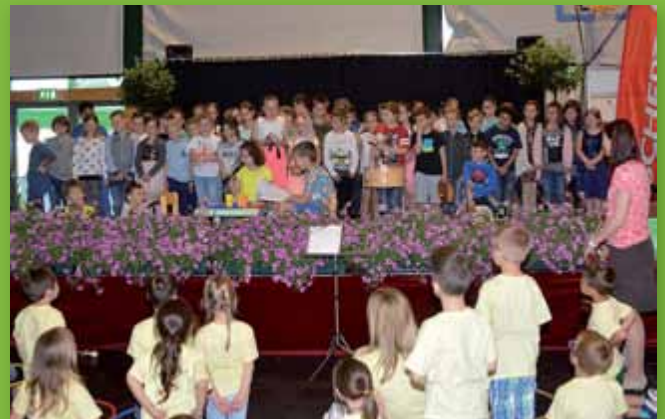
Viele Kinder bereicherten die Eröffnungsfeier der „AufLeben 2017“.

Mit 46 Ausstellern konnte im Mai d. J. die Messe „AufLeben“ zum zweiten Mal in der Ennstalhalle abgehalten werden.