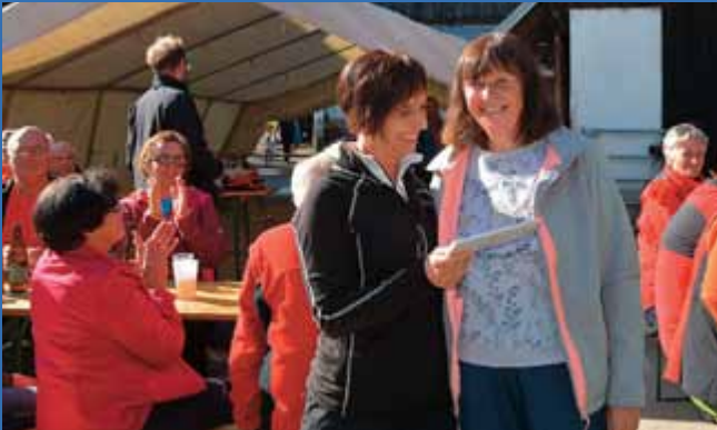
Die Siegerehrung des diesjährigen Liezen-Walks fand im Rahmen des Bürgermeister-Wandertages statt.

15 Gruppen bestehend aus 4 bis 5 Teilnehmern nahmen am virtuellen Walk nach Santiago de Compostela teil.