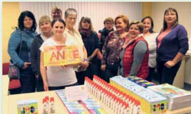
Die Tagesmütter und das Sozialzentrum der Volkshilfe Liezen bedanken sich recht herzlich für die freundliche Unterstützung zum Wohle unserer Kinder.

Mit viel Liebe und persönlichem Einsatz gestalten unsere Tagesmütter ihren Haushalt als anregendes Lernumfeld für die Tageskinder. Sämtliche Spiel- und Lernmaterialien werden dabei von der Tagesmutter selbst angeschafft und aus der eigenen Tasche bezahlt. Besonders Verbrauchsmaterialien wie Klebstoff, Buntstifte und Papier