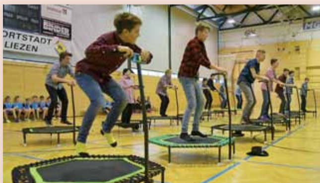
Die Schüler trainieren ihr Programm für die „Zirkus-Nacht des Sports“.

Traditionell startet im Herbst auch die neue Schülerligasaison. Wetterbedingt gab es leider nur ein Turnier. Das neuformierte