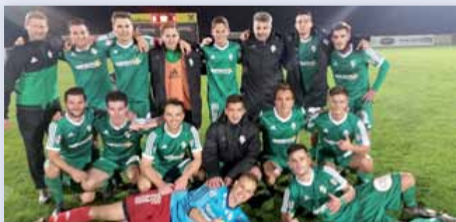
Die SC-Kicker mit ihren Trainern jubelten zum Saisonabschluss über den 1:0-Auswärtssieg gegen den SV Wildon.