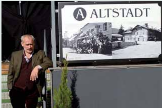
Die „Altstadt“ kann nicht nur für Filmdreharbeiten – hier im Bild der bekannte Schauspieler Johannes Krisch –, sondern auch Feiern jeglicher Art gebucht werden.

Anfang September öffnete mit dem „Altstadt“ ein lang ersehnter Wunsch der Liezener seine Pforten. Ein Lokal, in dem „man“ sich trifft und gemeinsam feiert, ob nach der Arbeit oder zu einer der vielen Veranstaltungen, die seit der Eröffnung schon organisiert wurden. Oktoberfest, Halloween Night, Junkerverkostung oder Heurigenwoche sind nur ein paar Auszüge des umfangreichen