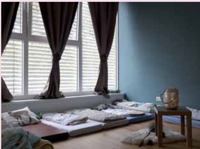
Die Kinderkrippe bietet Räume zum Spielen und Toben, aber auch Ruhezeiten zum Schlafen und Ausruhen.

So steht es im neuen Leitbild für Kinderbetreuung der Volkshilfe Steiermark.