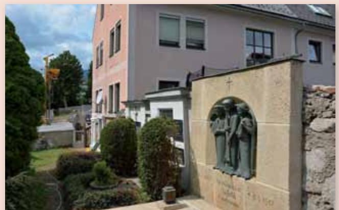
Das „Engerlgrab“ nach der aufwändigen Sanierung.

abgetragen, gereinigt und wieder neu aufgebaut. Die Kosten für die Sanierung der Nordmauer betragen rund € 60.000. Ziel ist es in den nächsten Jahren, den gesamten Friedhof in diesem Stil zu sanieren, und so einen Teil Liezener Geschichte zu bewahren. Ein Crowdfunding Projekt soll helfen dieses Vorhaben auch Realität werden zu lassen.