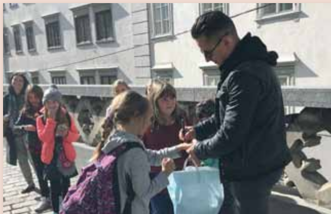
Die „Graz-Tage“ waren ein absolut unvergessliches Erlebnis.

Natürlich durften auch die „üblichen“ Sehenswürdigkeiten (Oper, Zeughaus, Schlossberg ...) nicht fehlen.