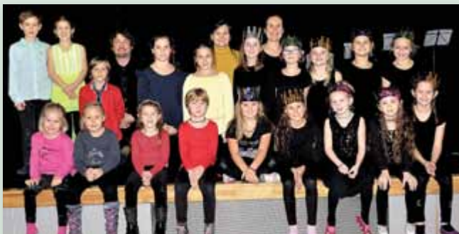
Am 9. November verzauberten die kleinen Künstler das Publikum mit einem wunderbaren Konzert. Die Geschichte der Königin Malwida und ihren Untertanen, den Farben, wurde mit Musik und Tanz aufgeführt.

Ein Kinderkonzert der Musikschule Liezen.