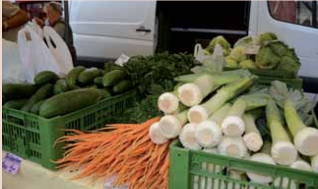
Das Projekt „Attraktivierung Bauernmarkt Liezen“ wird vom Rathaus aus umgesetzt und schon im Frühjahr 2018 erste Ergebnisse sichtbar machen.

zung nun am 7. November im vertraulichen Teil dieser Sitzung beschlossen, dass im neuen Jahr Stadtmarketing thematisch dem Referat Kommunikation und Marketing innerhalb des Rathauses zugeordnet wird. Mehrheitlich wird die Meinung vertreten, dass die kontinuierliche Negativberichterstattung von Stadtmarketing und Tourismus dem Image der Stadt in den vergangenen Jahren Schaden zugefügt hat. Dem will der Gemeinderat mit dieser Weichenstellung entgegenwirken. In welchem Ausmaß eine weitere, aktive Zusammenarbeit mit dem Tourismusverband passieren wird, liegt letztlich an den Verantwortlichen dieser Institution. Von Seiten der Gemeinde ist geplant, neben in-