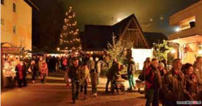
Der Christkindlmarkt Weißenbach zählt in der Region zu den vorweihnachtlichen Highlights.

Der traditionelle und stimmungsvolle Weihnachtsmarkt am Dorfplatz von Weißenbach bei Liezen öffnet am 1. Adventwochenende wieder seine Pforten.